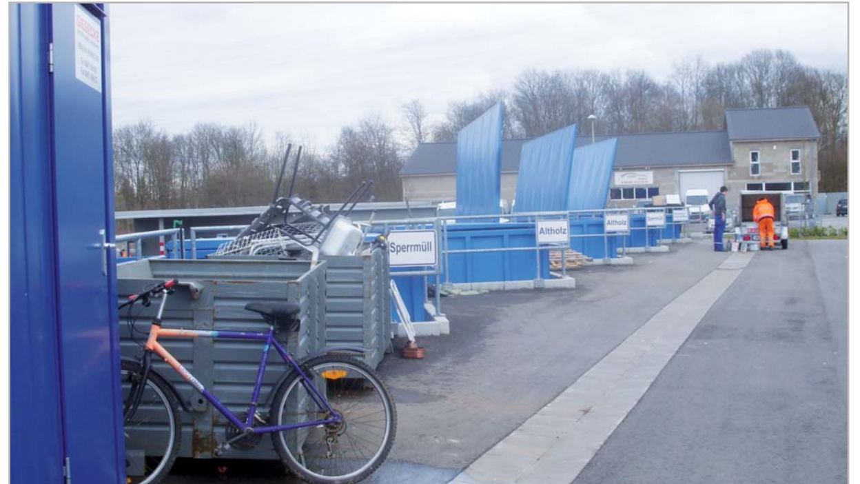
Wertstoffhof des EZV im Gewerbepark

Dies gilt auch bei vorübergehender Überfüllung der Papier- und Glascontainer für dort abgelegte Kartons und Flaschen. Wenn die Container voll sind, muss ein anderer Standplatz angefahren oder das Papier und das Glas wieder mitgenommen werden.