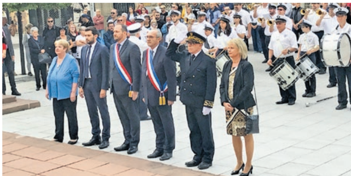
Gedenken beim Nationalfeiertag in Forbach

Die Fête nationale bildete einen weiteren Höhepunkt im diesjährigen Veranstaltungskalender der Jumelage zwischen Forbach und Völklingen, die mittlerweile seit mehr als 55 Jahren besteht. Die Oberbürgermeisterin dankte der Stadt Forbach ganz herzlich für die Einladung und die wunderbare Gastfreundschaft, die den Völklinger Gästen zuteil wurde.