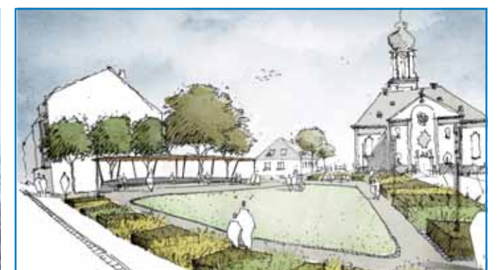
So könnte der Platz vor der Versöhnungskirche in Zukunft aussehen Quelle: HDK Dutt & Kist GmbH