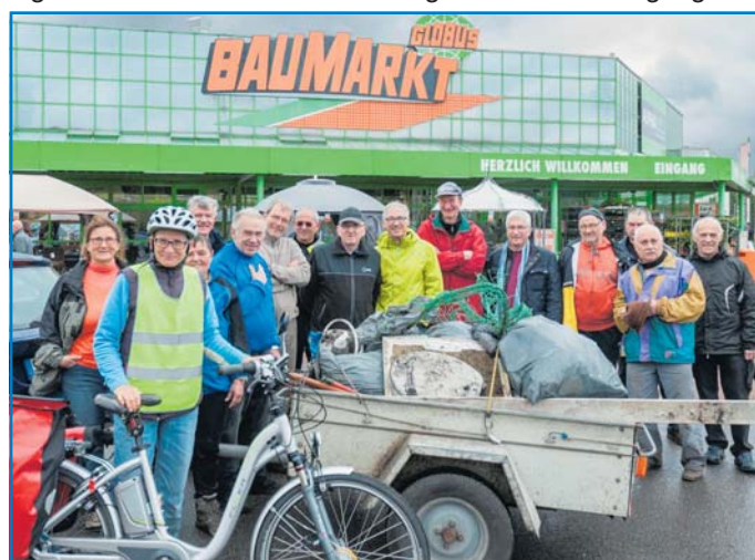
Säuberten gemeinsam den Radweg an der Saar: Mitglieder des ADFC mit Oberbürgermeister Klaus Lorig

leistete eine Sachspende für das Frühstück. Und der Globus Baumarkt in Völklingen stellte den Helfern einen Mittagimbiss zur Verfügung.