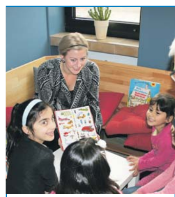
In der Lesecke