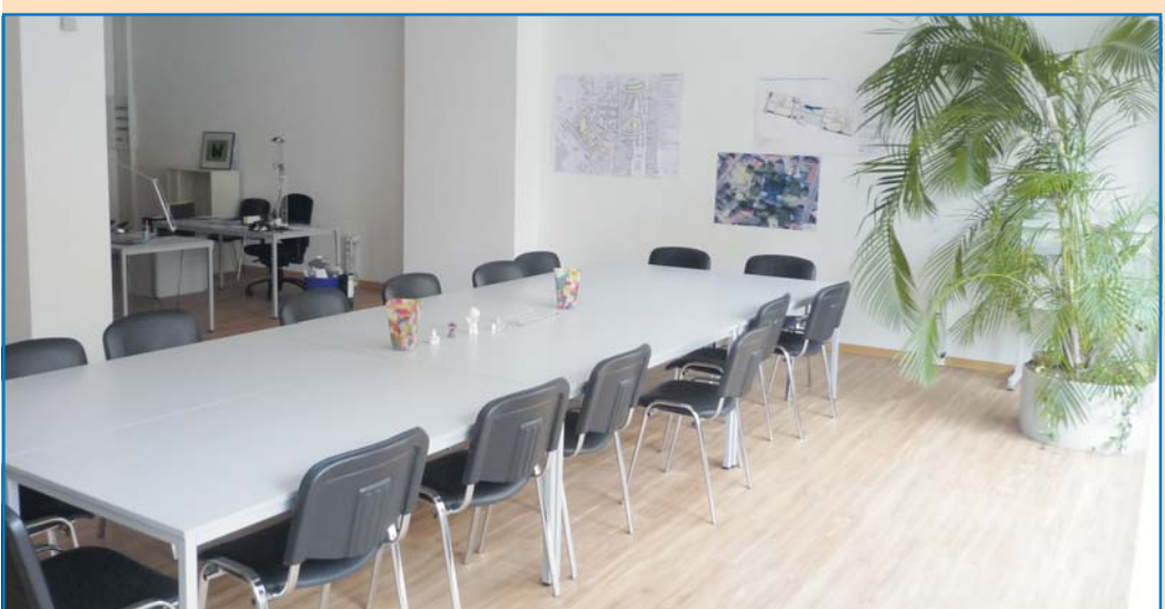
Helle Räume und genügend Platz zeichnen den neuen Stadtteiltreff aus