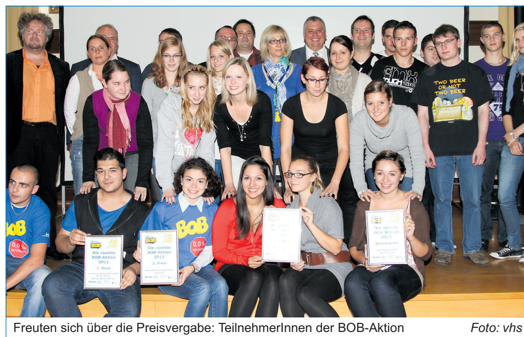
Freuten sich über die Preisvergabe: TeilnehmerInnen der BOB-Aktion