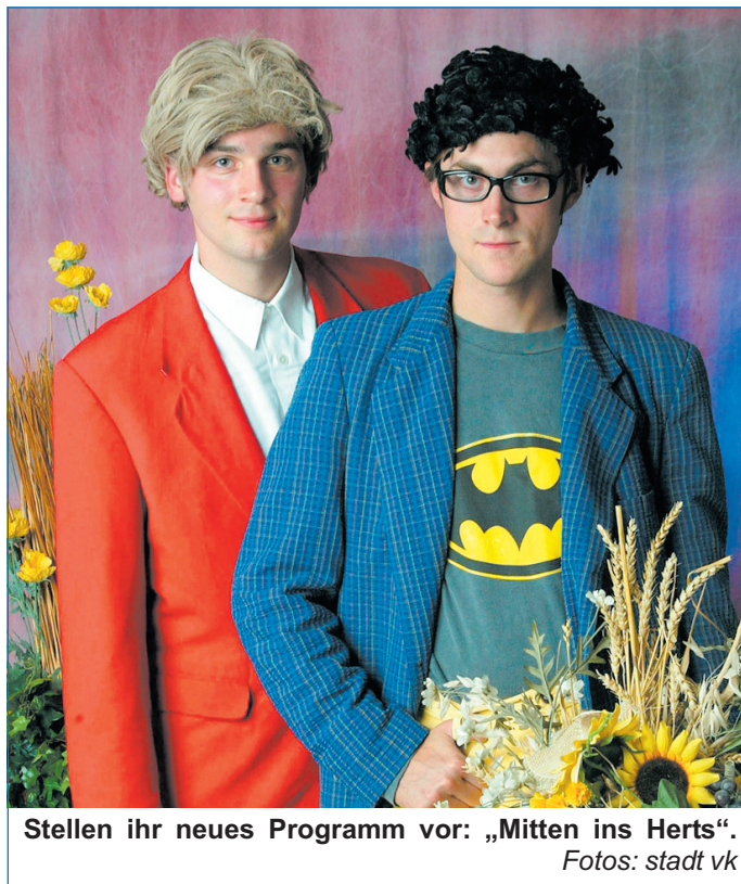
Stellen ihr neues Programm vor: „Mitten ins Herts“.

Das Vorprogramm bestreiten die Mäbinger Buwe Langhals & Dickkopp. Die berühmteste Nachwuchsgruppe Marpingens geht ins 30. Jahr ihres gemeinsamen Schaffens. Rein nach dem Motto „Hingehen on zuheere, ferdisch ab! Denn wer geht, der ist wenigstens einen Abend lang Dehäm ous derr Fieß“. Der Eintritt ist frei. Einlasskarten gibt es bei der Tourist-Info Völklingen, Poststraße 1, Telefon (06898) 13-2800.